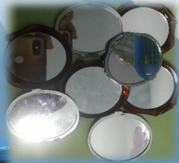
Зеркала хорошего настроения, Мягкие игрушки